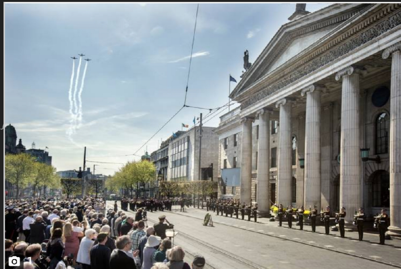
The GPO in Dublin. Photo: Tony Gavin 21/4/2019