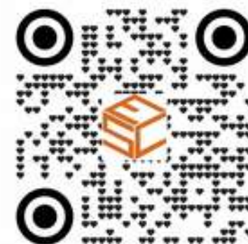
SeCube GRC - NIS2